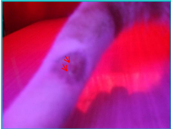
Photo 3 : Examen à la lumière de Wood. Noter les points de colorations verdâtres.