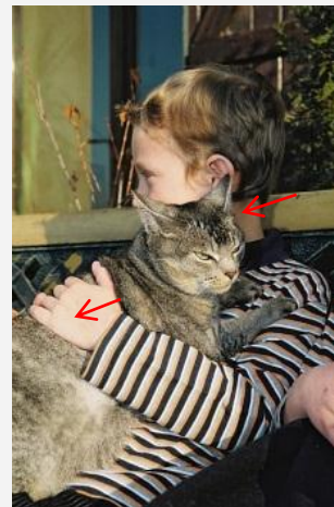
Photo 2 : Chez l'Homme, les lésions sont fréquentes sur les zones de contact avec les chats : visage, cou, avant-bras et mains.

Dans les cas de teigne humaine d'origine animale, des spores infectantes sont déjà présentes dans l'environnement et peuvent y persister longtemps. Il est souhaitable de consulter un vétérinaire afin de traiter tous les animaux du foyer, même s'ils ne présentent pas de signes cliniques. Un programme de désinfection des objets et des lieux contaminés doit être mis en place.